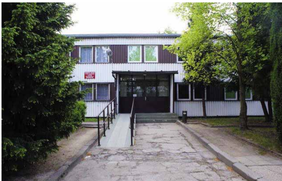
Tak była za czasów, kiedy studenci wkuwali anatomię