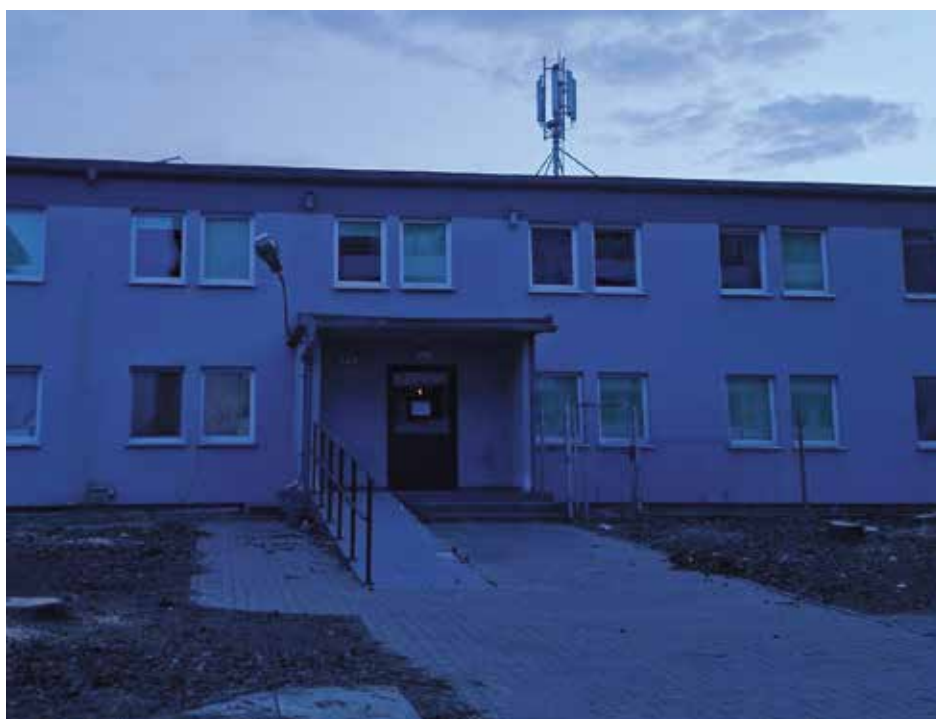
A teraz jest taki widok. Za moment wjedzie ciężki sprzęt, zburzą to co jest i powstanie coś nowego, zamiast zieleni.