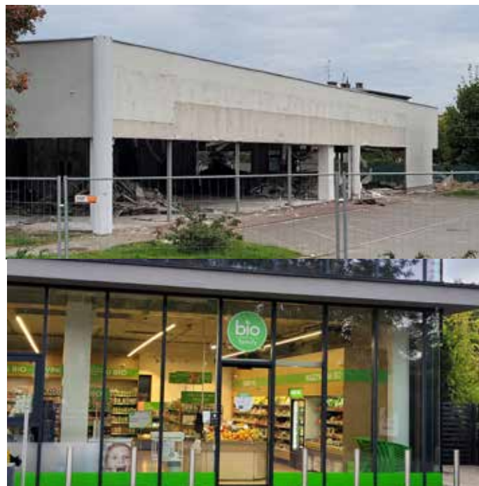
BIO - FAMILY

Nie ma też marketu z żywnością bio u zbiegu ulic Winogrady/Murawa. Nowa siedziba mieści się przy ulicy Kutrzeby.