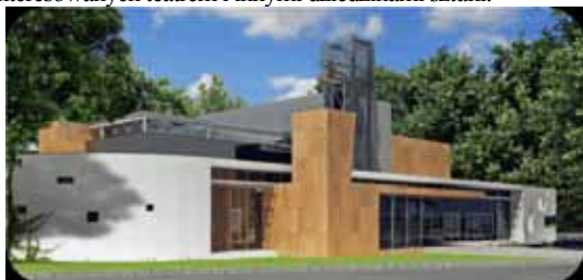
Widok z ulicy „Za Cytadelą”. Strona reprezentacyjna południowo-zachodnia wraz z głównym wejściem.

Nowy obiekt ma być miejscem integracji środowiska młodzieży oraz nauczycieli zainteresowanych teatrem i innymi dziedzinami sztuki.